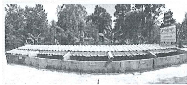
จึงเรียนมาเพื่อโปรดพิจารณา