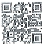
(QR Code สำหรับรายงานแผนฯ)

หมายเหตุ : ขอความร่วมมือทุกจังหวัด กรอกข้อมูลแผนการรณรงค์ประชาสัมพันธ์ในพื้นที่ผ่านระบบออนไลน์ (ตาม QR Code) ภายในวันศุกร์ที่ ๒๙ พฤษภาคม ๒๕๖๙ เพื่อเป็นข้อมูลสำหรับประชาสัมพันธ์ผ่านสื่อมวลชนในภาพรวมของประเทศต่อไป